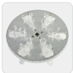
名称: 细胞涂片转子 最大容量: 6卡片 最高转速: 3000r/min 最大离心力: 730xg 订货号: 0302856510