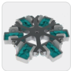
名称: 水平吊篮涂片转子 最大容量: 6卡片 最高转速: 2000r/min 最大离心力: 545xg 订货号: 0302855810