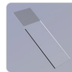
名称: 载玻片 订货号: 0310856514