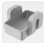
名称: 吊篮 订货号: 0303855804