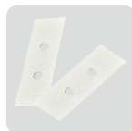
名称: 吸水垫 订货号: 0308855524