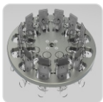
名称: 细胞涂片转子 最大容量: 12卡片 最高转速: 3000r/min 最大离心力: 890xg 订货号: 0302856520