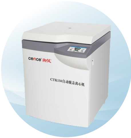
CTK150大容量低速（自动脱盖）