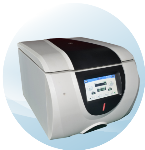
CTK64低速台式常温（自动脱盖）