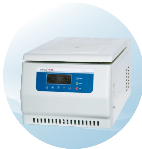
CTK64R低速台式冷冻（自动脱盖）